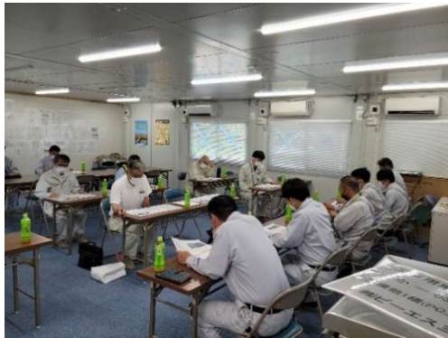
事務所にて工事概要説明