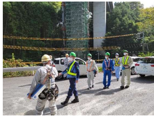
工所用エレベータ乗り込み前