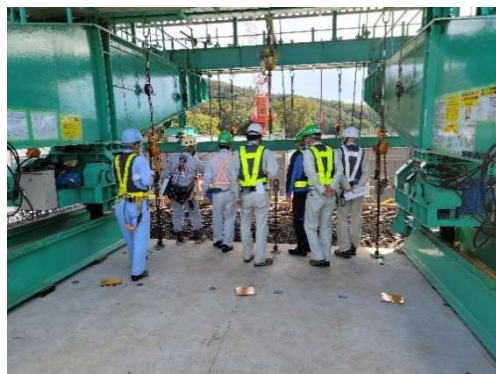
移動支保工付近 (川関橋)