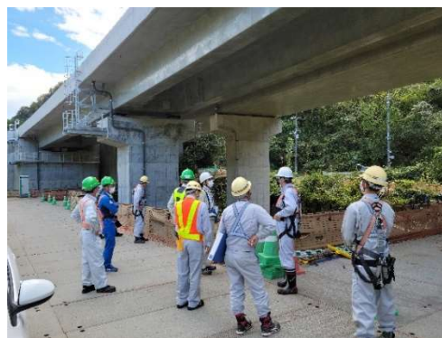
橋梁下面の状況 (神明第二橋)