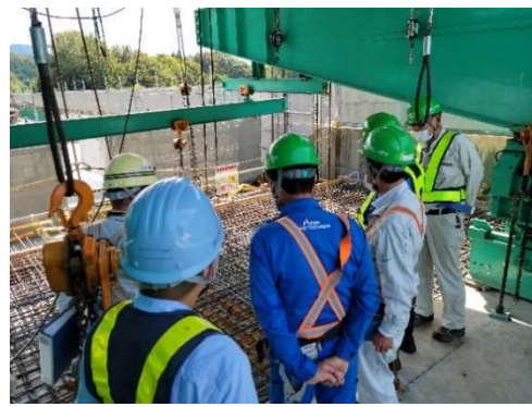
配筋状況の確認 (川関橋)