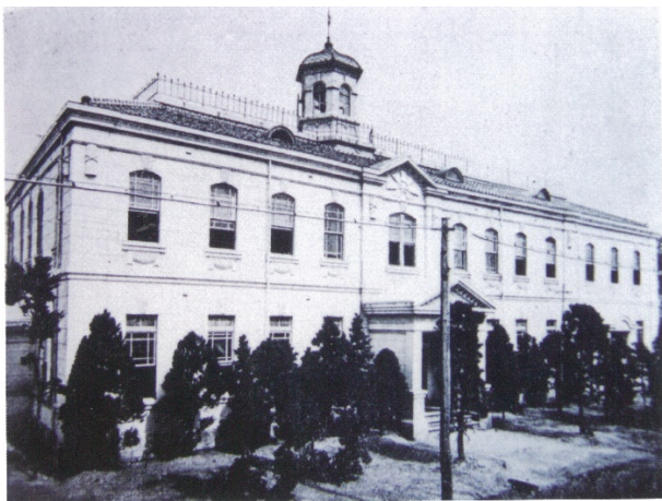
米子町庁舎大正終り頃（昭和4年焼失）※4 米子市立山陰歴史館蔵