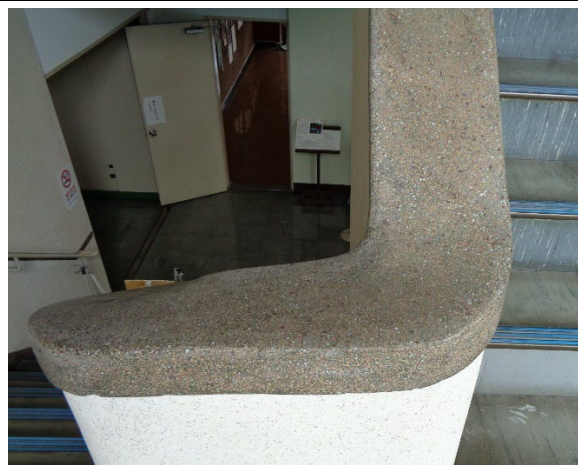
階段手摺 テラゾー（人造石研ぎ出し）仕上げ 職人の手仕事