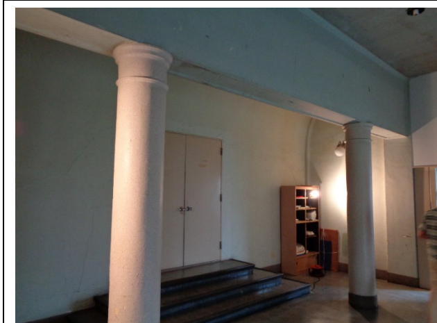
3階 貴賓室前 装飾柱が設けられている。 床高さを3段分高くし、空間を切り替えている。