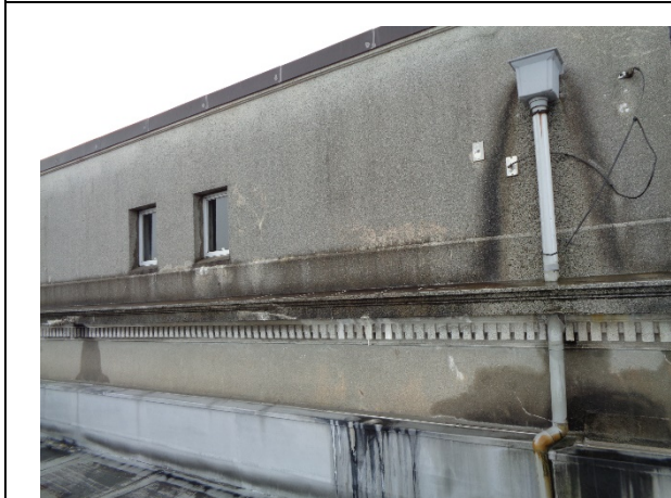
屋上 屋根スラブは露出防水で改修されている。 この部分がアルミサッシに改修。