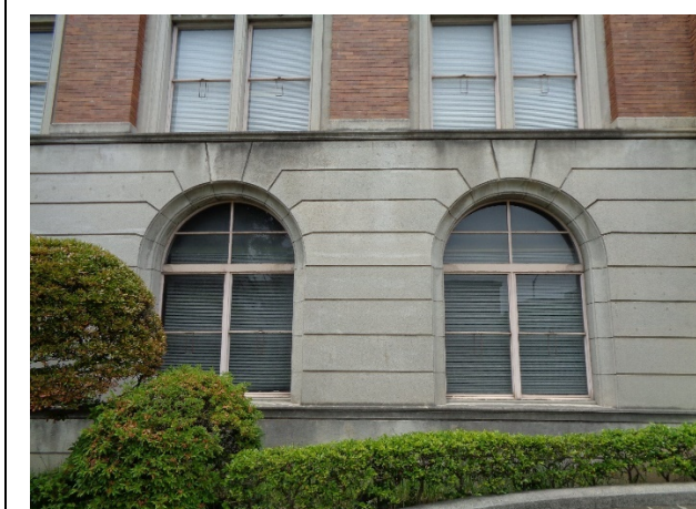
外壁 上 部：タイル張り 中間部：白色人造石塗り 腰 部：人造石小叩き仕上げ ※壁面全体に凹凸やはらみは認められない。