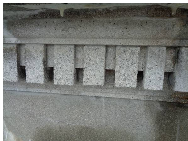
軒先の細工 人造石塗仕上げ 下地が興味深い