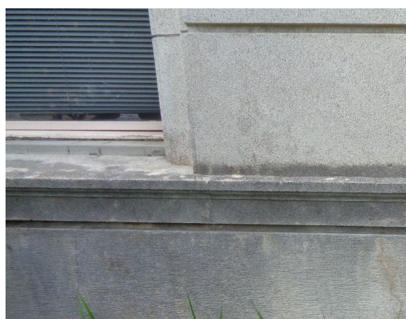
外部詳細 中間部：白色人造石塗り 腰 部：人造石小叩き仕上げ