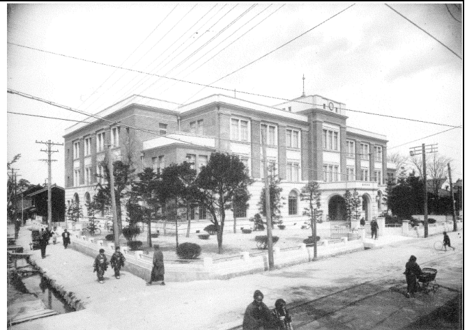
竣工当時の様子と思われる。※4 和服姿の市民の往来。道路幅は狭い。